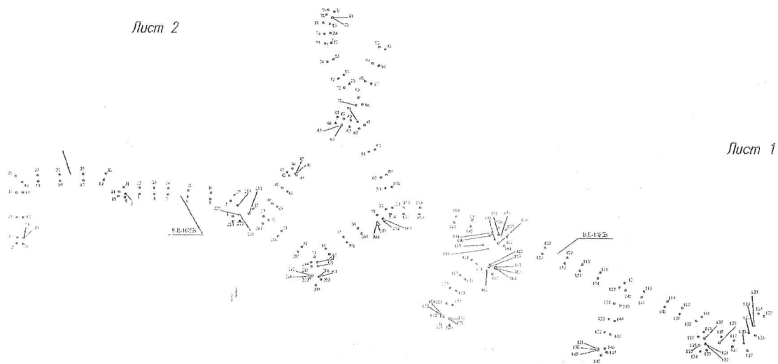
Схема расположения листов ВЛ-10КВ