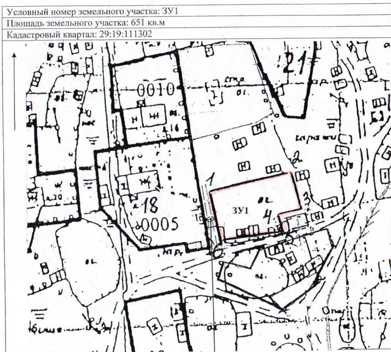
Схема расположения земельного участка на кадастровом плане территории