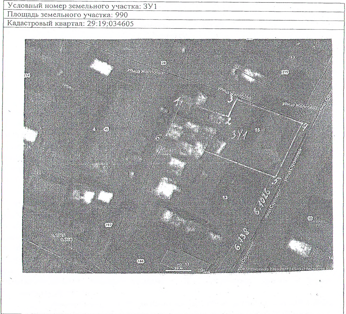
Схема расположения земельного участка на кадастровом плане территории