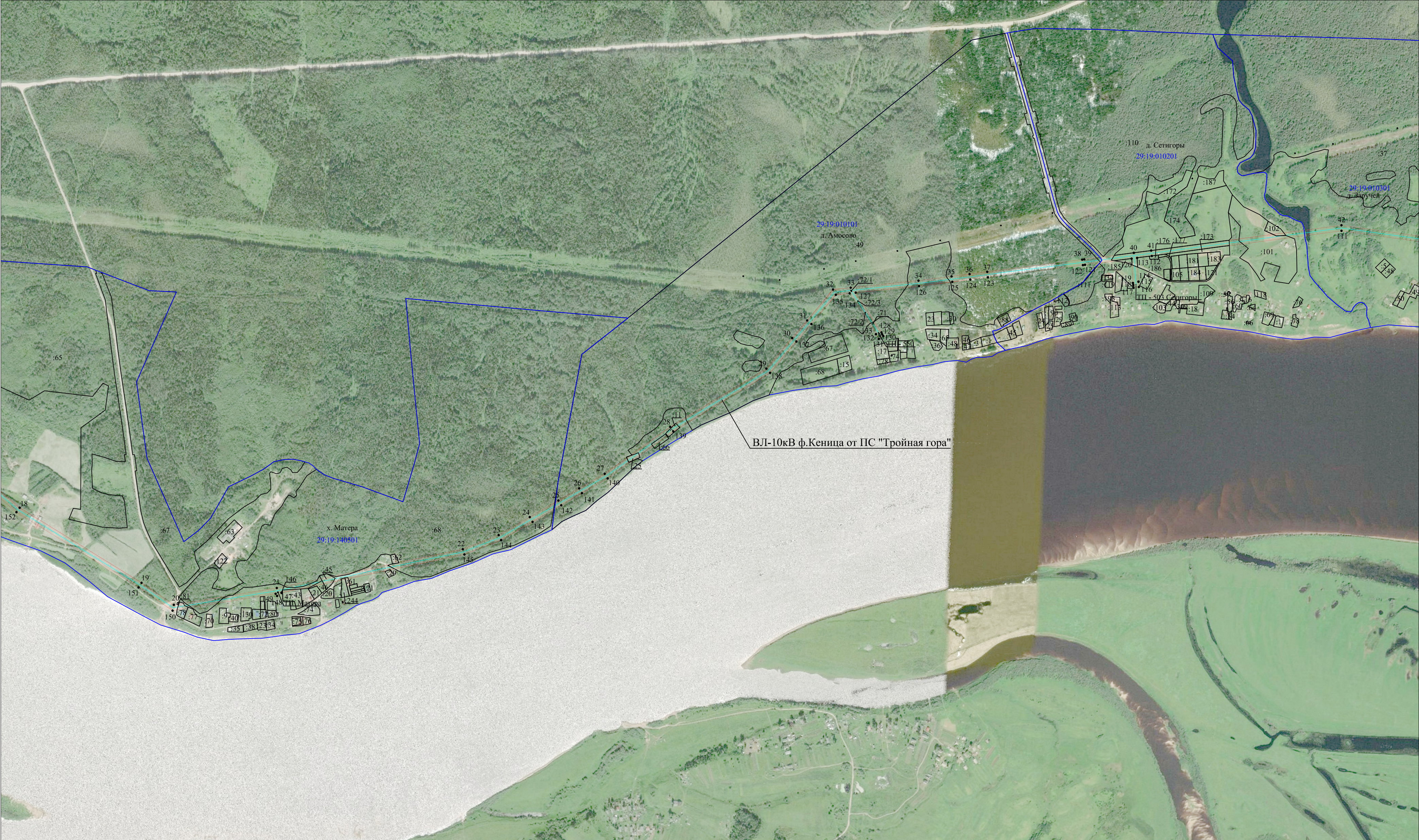
Масштаб 1:10 000