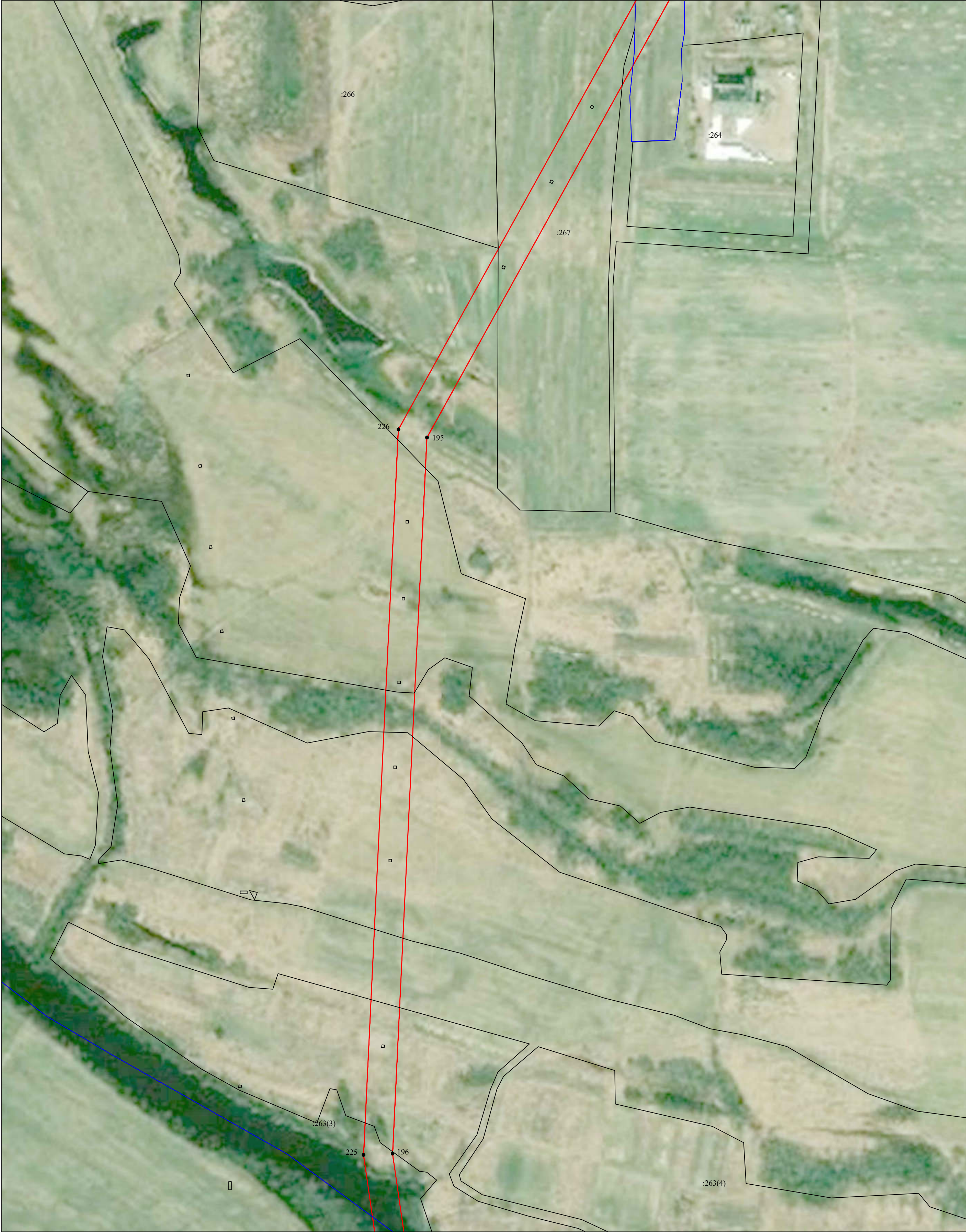
Масштаб 1:2 000