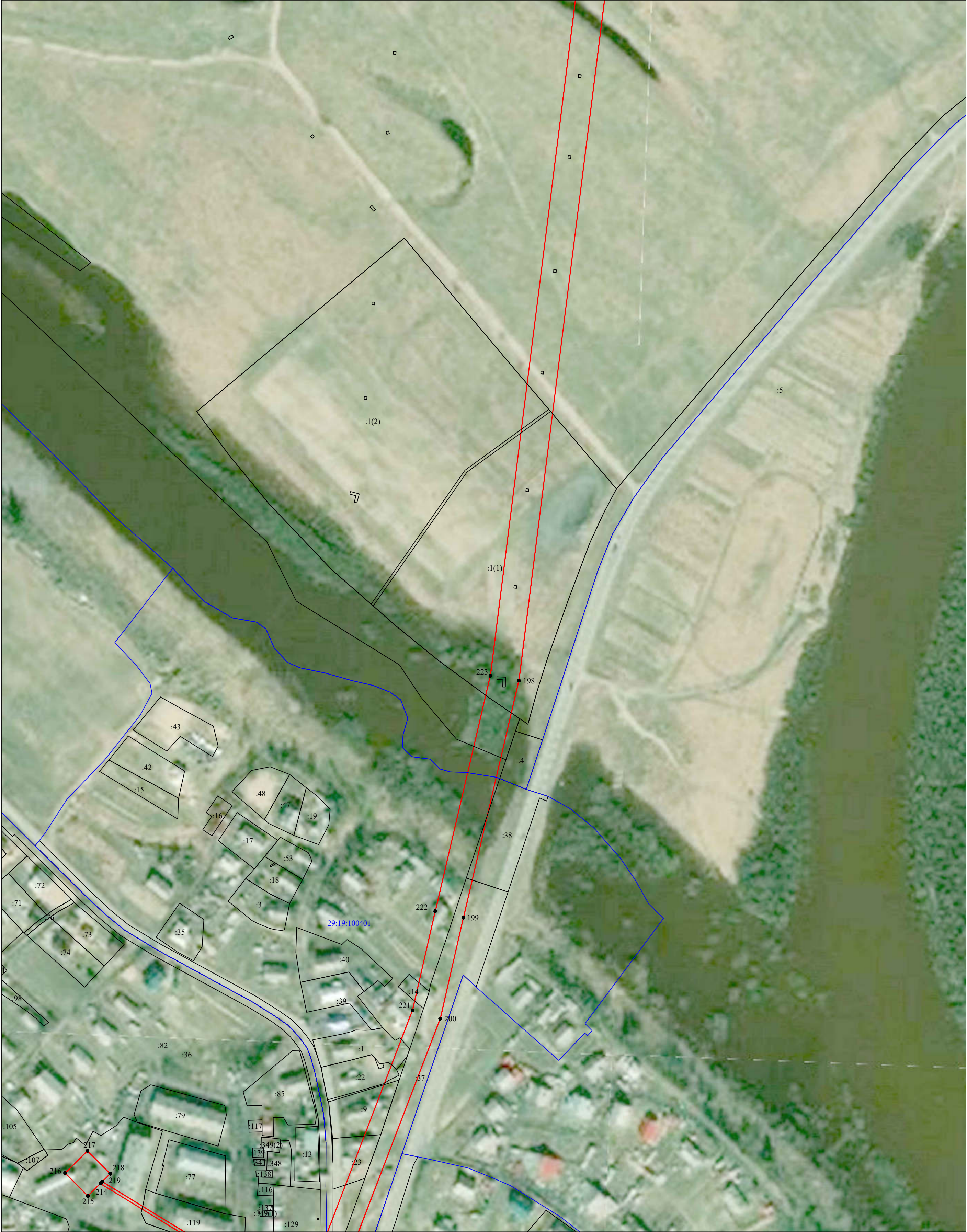
Масштаб 1:2 000