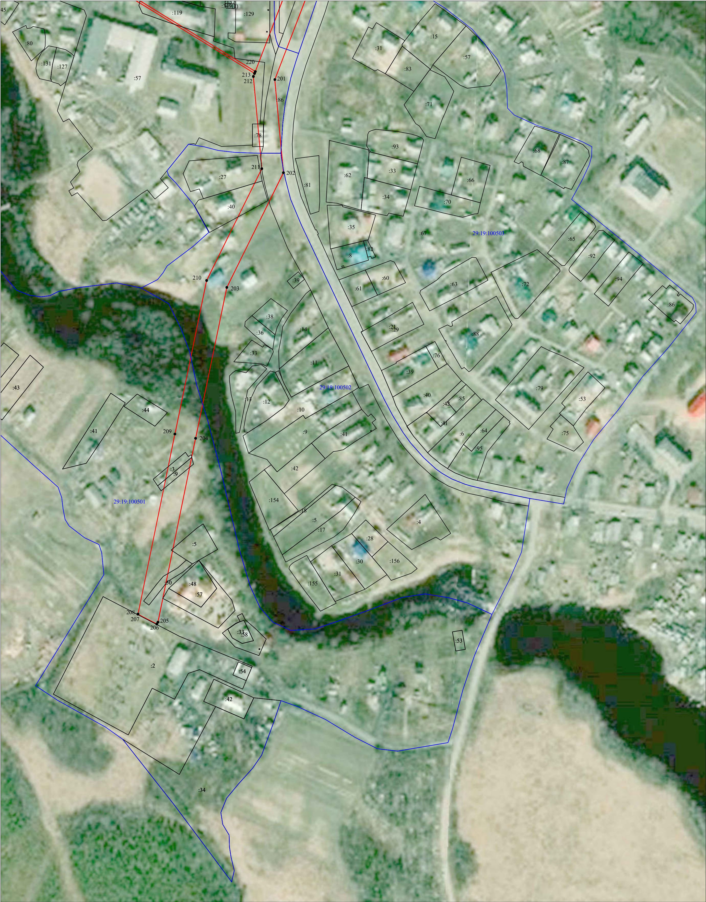
Масштаб 1:2 000